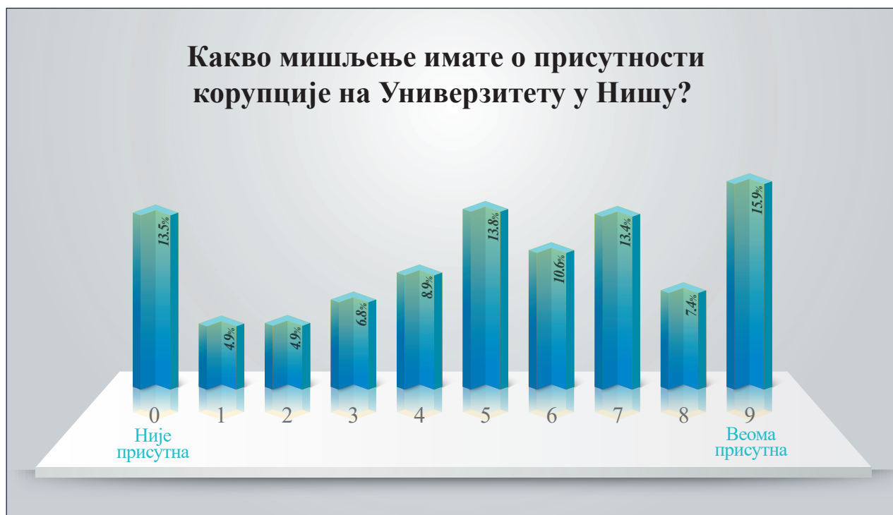
Мишљење анкетираних о присутности корупције на Универзитету у Нишу у целини на узорку од 1229 студената

Што се перцепције корупције на Универзитету у Нишу у целини тиче, резултати анкете су још упечатљивији, па тако 86,5% анкетираних перципира да постоји корупција на Универзитету, при чему 15,9% анкетираних мисли да је корупција на Универзитету екстремно изражена, док 13,5%, верује да на Универзитету уопште нема корупције.