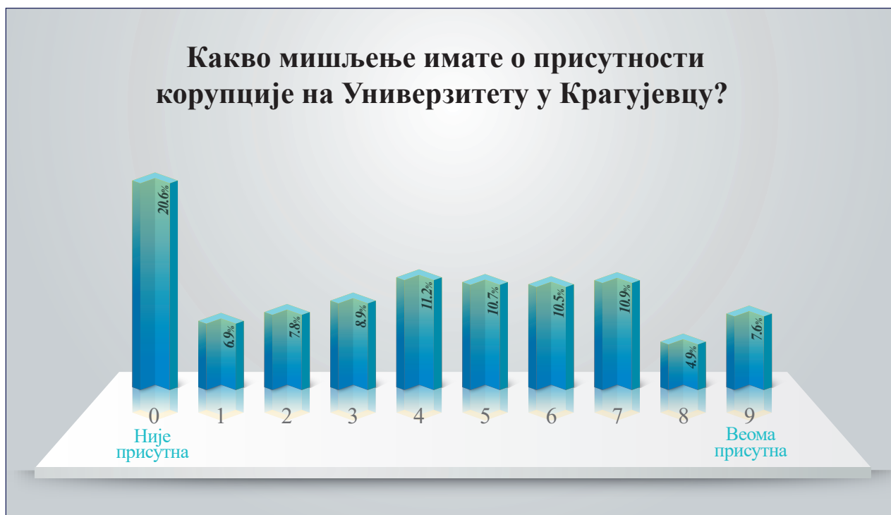
Мишљење анкетираних о присутности корупције на Универзитету у Крагујевцу у целини на узорку од 552 студената

Што се перцепције корупције на Универзитету у Крагујевцу у целини тиче, резултати анкете су још упечатљивији па тако 79,4% анкетираних перципира да постоји корупција на Универзитету, при чему 7,6% анкетираних мисли да је корупција на Универзитету екстремно изражена док 20,6%, сматра да на Универзитету уопште нема корупције.